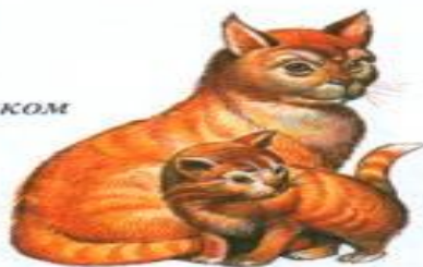
кошка с котенком