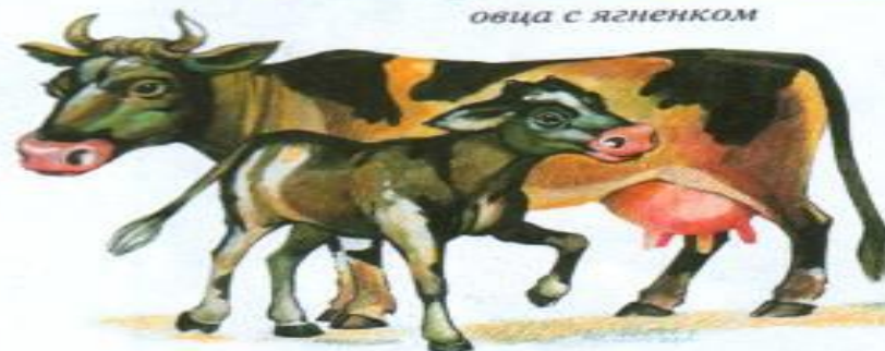
корова с теленком