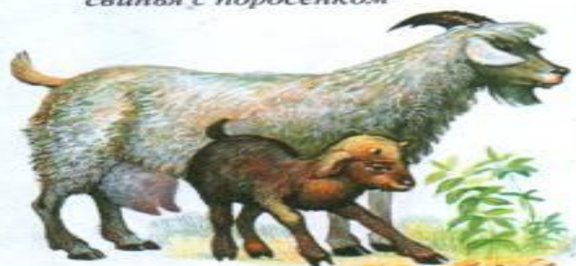
коза с козленком