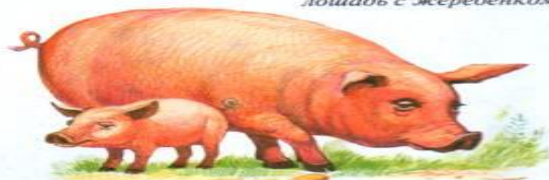
свинья с поросенком