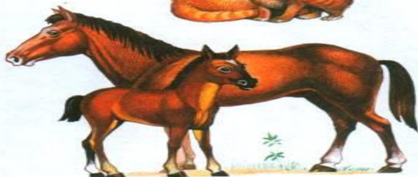
лошадь с жеребенком