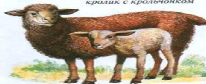
овца с ягненком