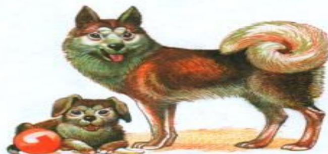
собака со щенком